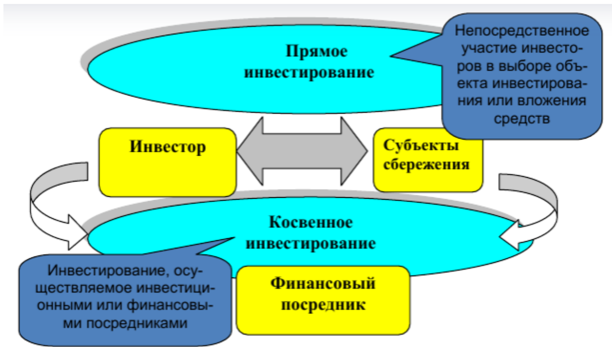
Рис. 5. Прямое и непрямое инвестирование